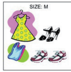
Clothing - 1 page worksheet - what size.doc